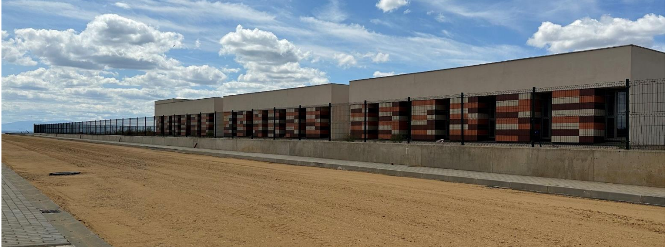
Obras del Centro Residencial para la Tercera Edad de Villadangos y de la nueva calle entre el Senderico y el Camino ancho

Como extensión de la propia Residencia, se ha adquirido un inmueble colindante con el Centro Cívico de Villadangos para CREAR UN CENTRO DE DÍA , donde personas que aún puedan y quieran vivir en sus casas, puedan recibir atención y cuidados durante el día.