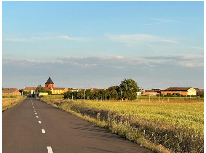
Campos de Fojedo desde el nuevo acceso asfaltado por Carrovelilla

Seguiremos reparando caminos vecinales. Por ejemplo, llevaremos a cabo un ARREGLO INTEGRAL DEL SENDERICO, y ENSANCHAREMOS EL CAMINO DE LAS MAJADAS Y EL DE LAS PISCINAS, entre otros.