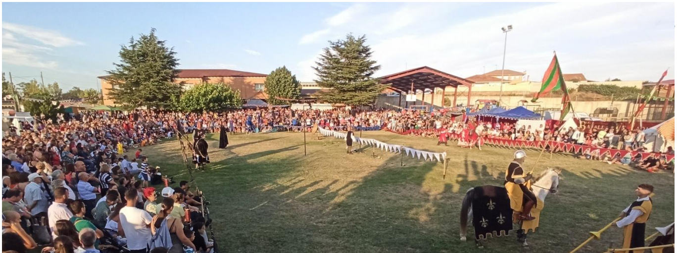
Torneo a caballo durante "La Batalla de Villadangos"

Seguiremos potenciando eventos culturales como la Feria Medieval de “La Batalla de Villadangos”, el Encuentro de Narradores “Cuentoral” de Celadilla, o el Festival “La Música es Cultura” de Foledo.