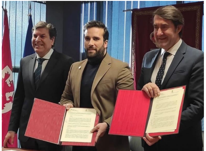
Firma de la Ampliación del Polígono de Villadangos

Pero el atractivo turístico que va a suponer un antes y un después para nuestro municipio será el PLAN DE SOSTENIBILIDAD TURÍSTICA EN DESTINOS DE LA LAGUNA DE VILLADANGOS , con el que hemos logrado captar más de 1.225.000 € de los Fondos de Recuperación Next Generation de la Unión Europea . Este importante proyecto, que está superando ya todos los permisos y la tramitación medioambiental, será un punto de referencia turística de primer orden.