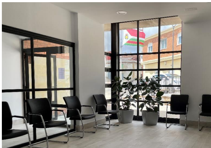
Consultorio Médico de Villadangos tras la reforma

Ahora, después de muchas restricciones, SE CONSTRUIRÁ UN NUEVO CONSULTORIO LOCAL DE FOJEDO , un espacio renovado y moderno donde SE RECUPERARÁ LA ASISTENCIA SANITARIA PRESENCIAL . Se construirá en un inmueble que ya es propiedad municipal, a través del Fondo de Cooperación Económica Local de la JCyL.