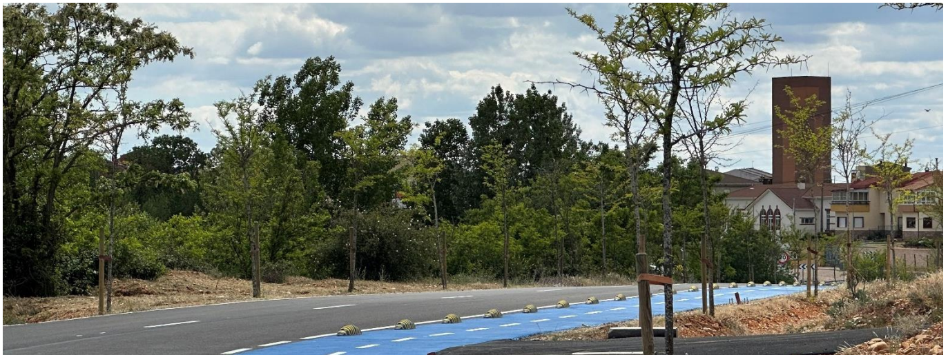
Nuevo vial entre el pueblo de Villadangos y la Urbanización

TAMBIÉN SE ACTUARÁ PARA HACER MÁS AMABLE LA FRANJA ENTRE LA N-120 Y LA AV. EL MONTICO , así como para que, con los permisos de Patrimonio y Ministerio, podamos ACTUAR DE FORMA INTEGRAL EN TODO EL VIAL PARALELO A LA N-120 QUE CORRESPONDE CON EL CAMINO DE SANTIAGO , desde su entrada frente al Polígono hasta la llegada al Colegio.