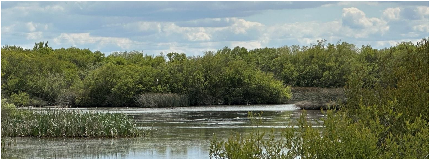
Laguna de Villadangos o “El Estanque”

Para la ejecución del proyecto SE LLEVARÁ A CABO LA RESTAURACIÓN Y CONSOLIDACIÓN DE “EL ESTANQUE” reparando sus muros y compuertas, así como mejorando el aprovechamiento de agua de los caños cercanos, la limpieza de cunetas y desagües, y el soterramiento de algunas de las redes que sobrevuelan la laguna.