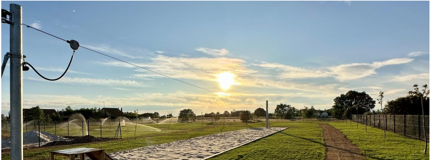
Nuevo parque y zona verde en la Urbanización

Respecto al transporte público, e independientemente de las líneas regulares de autobuses, trabajaremos para MEJORAR E IMPLEMENTAR UN TRANSPORTE A LA DEMANDA QUE LLEGUE A TODOS LOS NUCLEOS DE POBLACIÓN DEL MUNICIPIO . Además, desde el Ayuntamiento, APROBAREMOS UNA ORDENANZA REGULADORA DEL SERVICIO DE TAXI PARA CREAR UNA PLAZA TAXI EN VILLADANGOS .